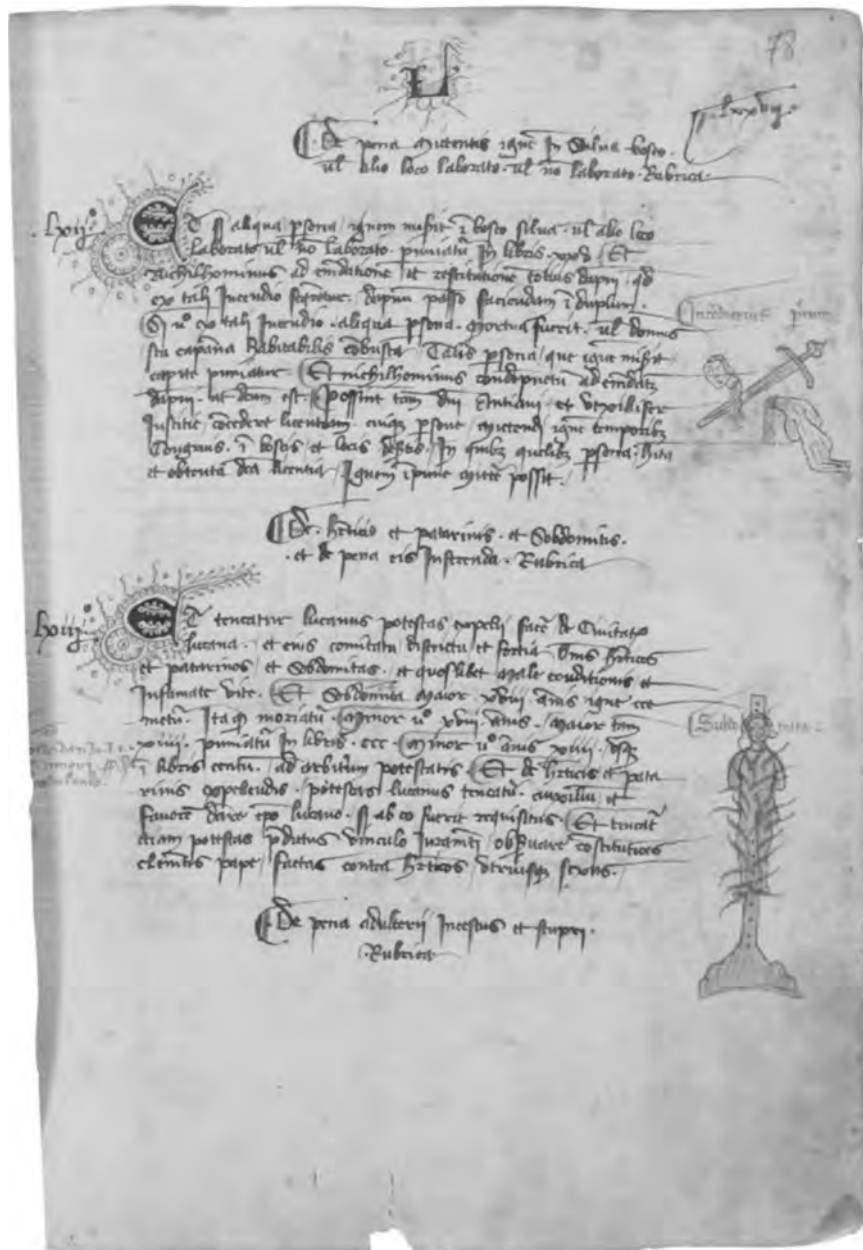
Tav. 4: Lucca, Biblioteca Statale, ms. 386, f. 78r Su concessione del Ministero per i Beni e le Attività culturali. Divieto ulteriore di riproduzione con qualsiasi mezzo.