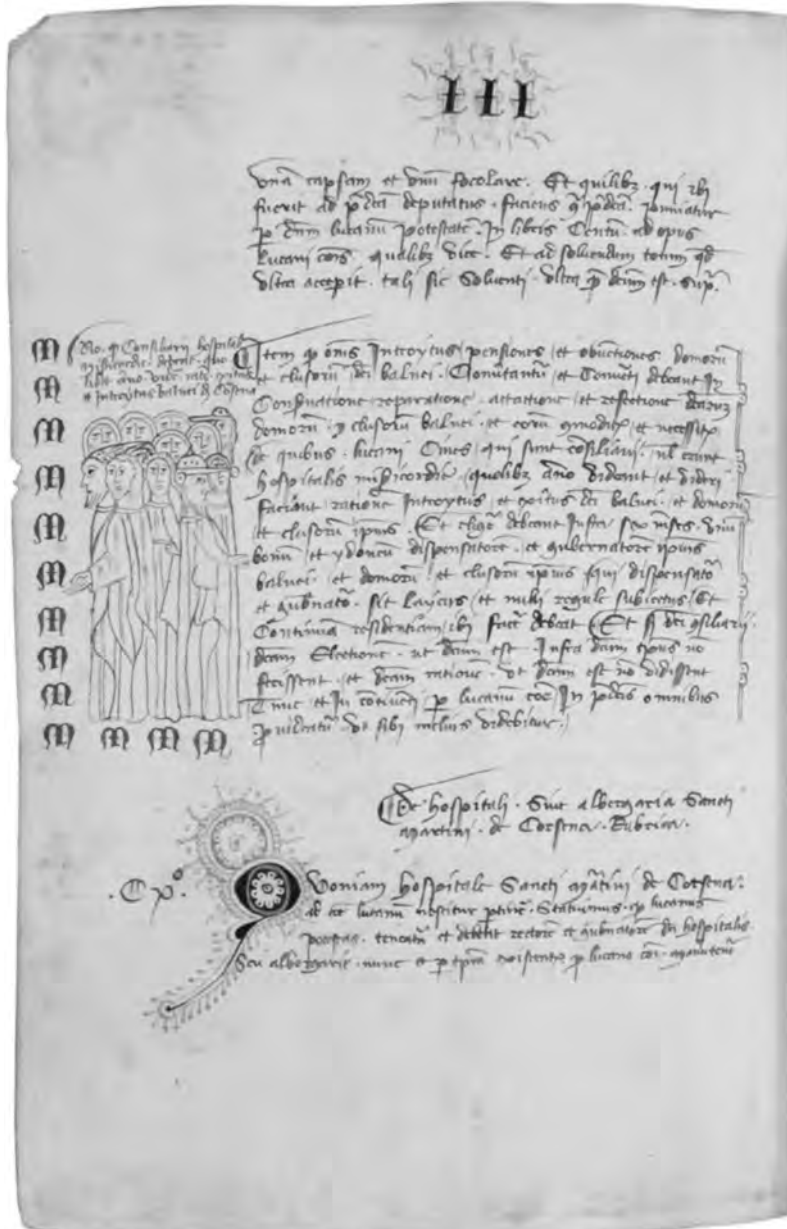
Tav. 6: Lucca, Biblioteca Statale, ms. 386, f. 192v Su concessione del Ministero per i Beni e le Attività culturali. Divieto ulteriore di riproduzione con qualsiasi mezzo.