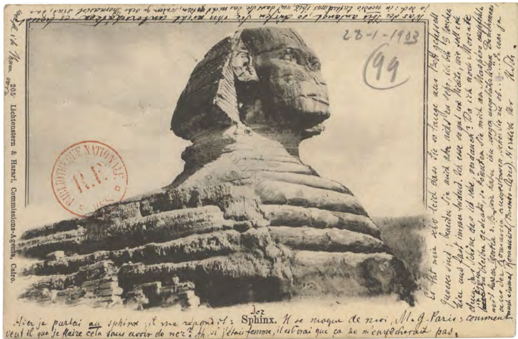
Hugo Schuchardt à Gaston Paris, fin janvier 1903 (l. 181) gallica.bnf.fr/Bibliothèque nationale de France, NAF 24457, f. 99.